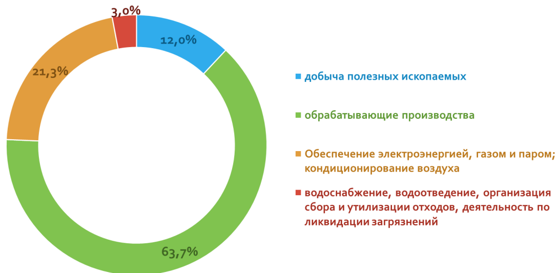
Отраслевая структура промышленности

В отраслевом разрезе наибольшую долю в структуре промышленного производства занимают отрасли, относящиеся к разделу «Обрабатывающие производства».